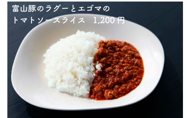
富山豚のラグーとエゴマの トマトソースライス 1,200円