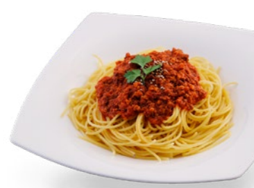
富山豚のラグーと エゴマのトマトソース パスタ 1,200円 Spaghetti Bolognese topped with perilla frutescens 1,200yen