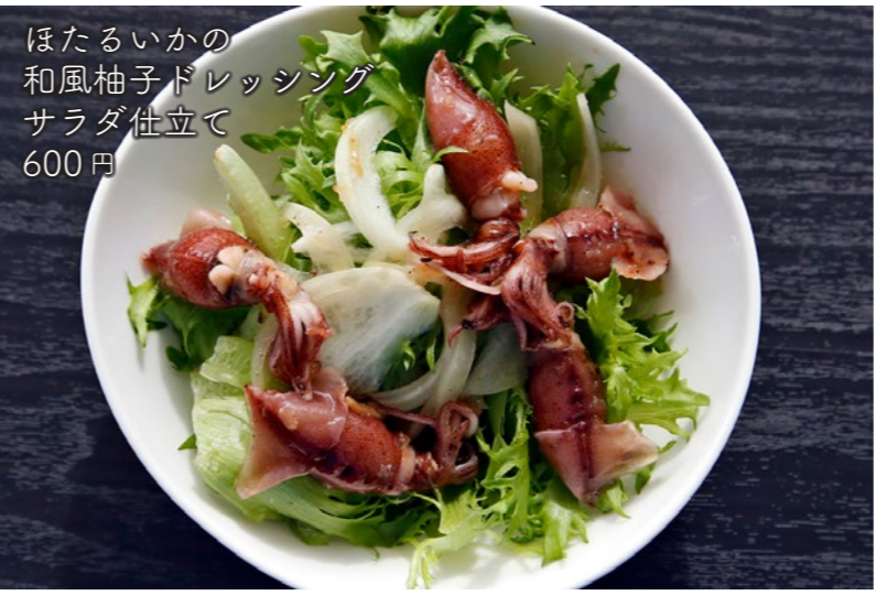
ほたるいかの 和風柚子ドレッシング サラダ仕立て 600円