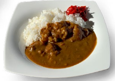
ビーフカレーライス 1,200円 Beef curry 1,200yen