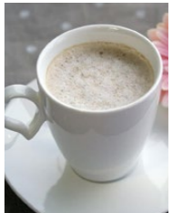
深層水コーヒー coffee made with the desalinated deep sea water

窓の外に広がる富山湾の 深層水を脱塩して淹れた 自慢のコーヒーです。 ぜひ、ご賞味ください。