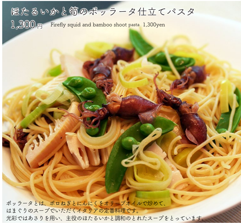
ほたるいかと筍のポッラータ仕立てパスタ 1,300円 Firefly squid and bamboo shoot pasta 1,300yen

ポッラータとは、ポロネギとにんにくをオリーブオイルで炒めて、 はまぐりのスープでいただくイタリアの定番料理です。 光彩ではあさりを用い、主役のほたるいかと調和のとれたスープをとっています。