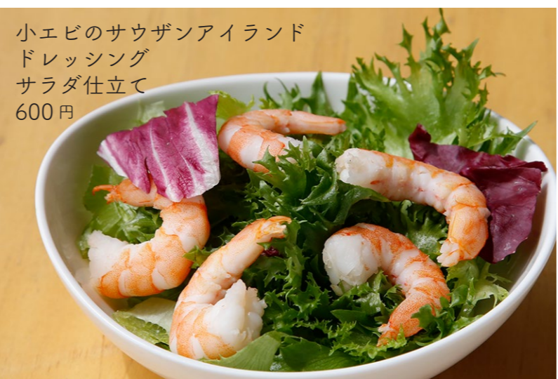
小エビのサウザンアイランド ドレッシング サラダ仕立て 600円