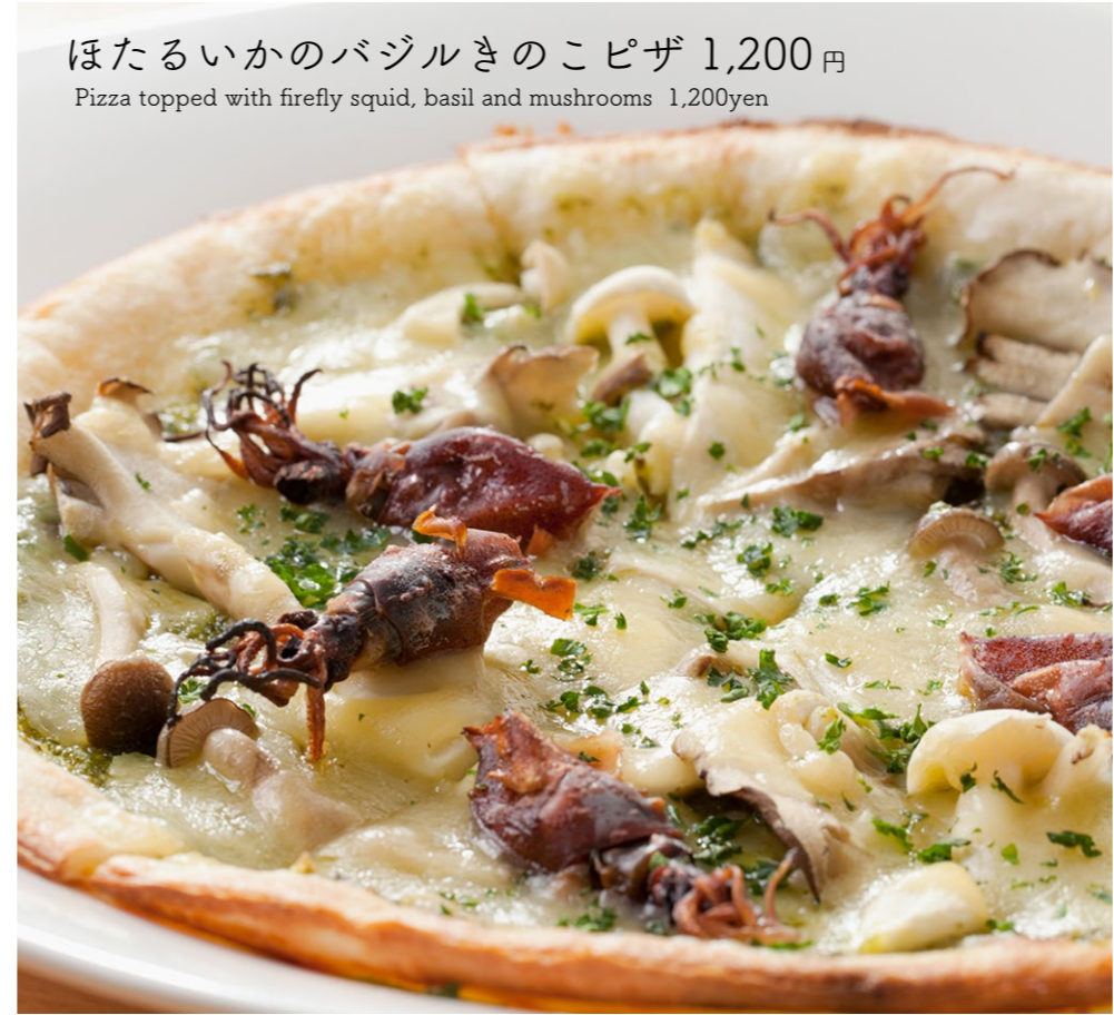
ほたるいかのバジルきのこピザ 1,200円 Pizza topped with firefly squid, basil and mushrooms 1,200yen

ポッラータとは、ポロネギとにんにくをオリーブオイルで炒めて、 はまぐりのスープでいただくイタリアの定番料理です。 光彩ではあさりを用い、主役のほたるいかと調和のとれたスープをとっています。