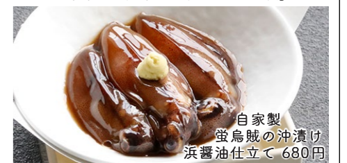
自家製 蛍烏賊の沖漬け 浜醤油仕立て 680円 Okizuke:salty fermented firefly squid, processed freshly.