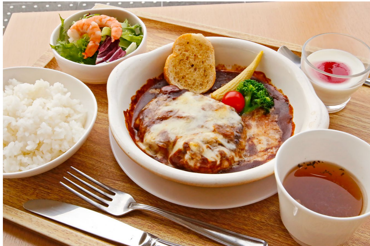
Recommended set 1,400yen Hamburg steak with cheese and demi-glace sauce / Mini salad of boiled shrimp / Rice / Soup / Mini dessert