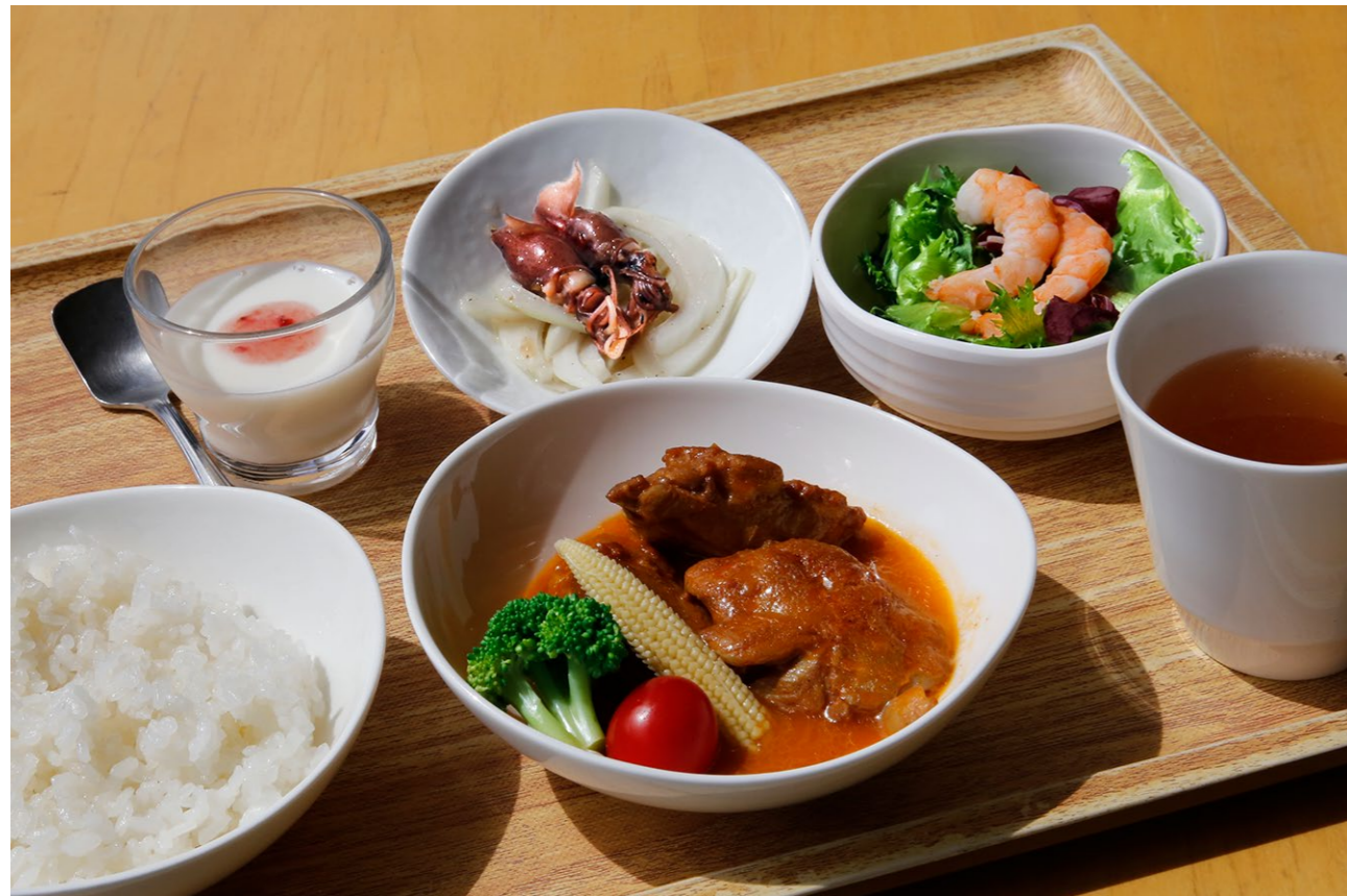
Recommended set 1,400yen Butter chicken curry / Rice / Marinated firefly squid / Mini salad of boiled shrimp / Soup / Mini dessert