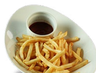
フライドポテト550円 french fries with ketchup