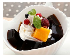
深層水コーヒーゼリー 450円 deepsea water coffee jelly 450yen