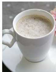
深層水コーヒー 400円 coffee made with the desalinated deep sea water 400yen

窓の外に広がる富山湾の深層水を脱塩して淹れた自慢のコーヒーです。ぜひ、ご賞味ください。