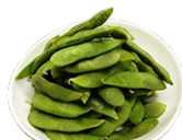
黒豆の枝豆 400円 saltwater-boiled soy-beans