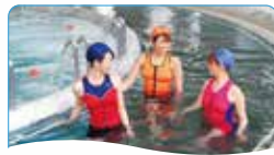
6 歩行浴 流れに逆らって歩き運動効果もアップ