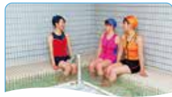
8 ミネラルソルティールーム ミネラルイオンに満たされながら、体の代謝を内外から促進