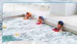
3 寝湯 内壁からの水圧で心地よくマッサージ