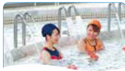
4 キャノンベンチ 打たせ湯。背・肩に刺激し肩こり解消