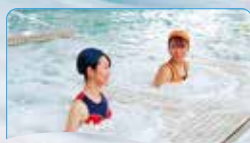
2 マグナムホール 勢いのある水流と泡でお腹周りを刺激しシェイプアップ