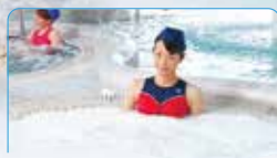
1 ジャグジー・パイプバス・バブルホール 大小の泡、乱流で全身の筋肉疲労を回復